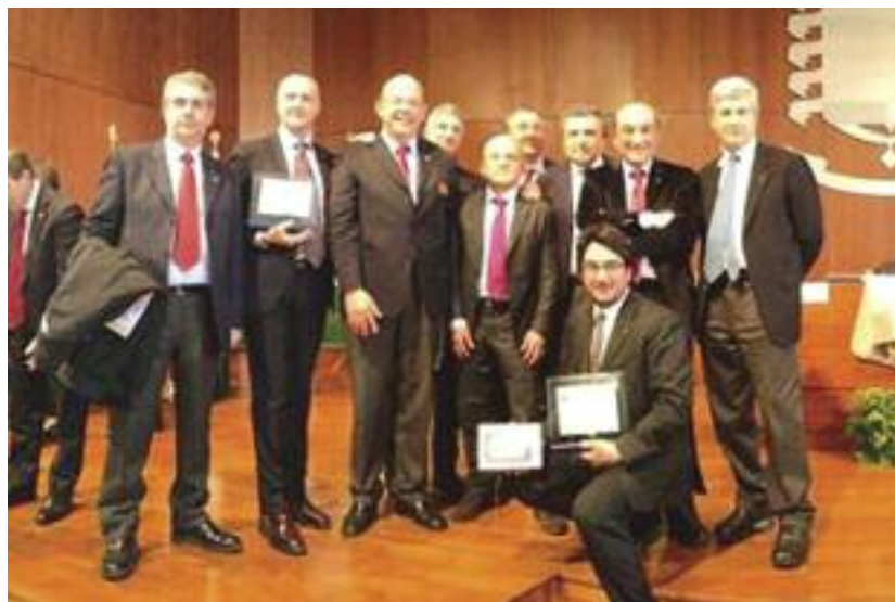
Il governatore Maurizio Triscari con i presidenti dei club siciliani

A Roma Forum nazionale su etica sociale e culturale: numerosi i ragazzi e i Club di tutta Italia che hanno partecipato. Molti i siciliani che hanno ricevuto importanti riconoscimenti. Una giovane di Lampedusa commuove con il suo tema e vince il primo premio per la composizione