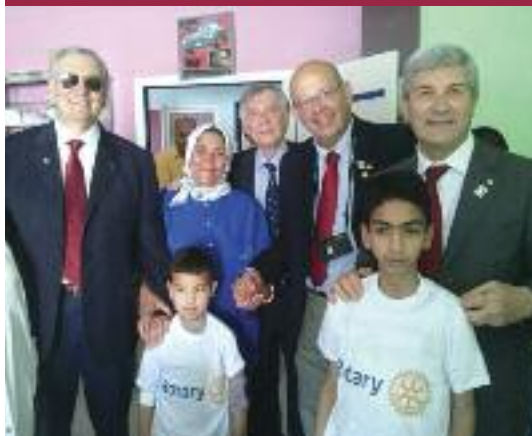
La cerimonia di consegna dei microinfusori a Oujda