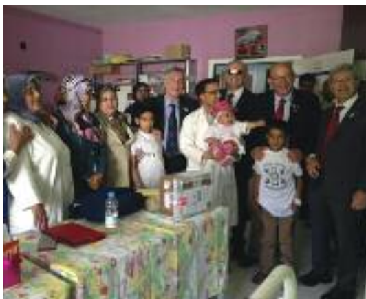
Cerimonia di consegna dei microinfusori nel Day Hospital di pediatria dell'ospedale Al Farabi