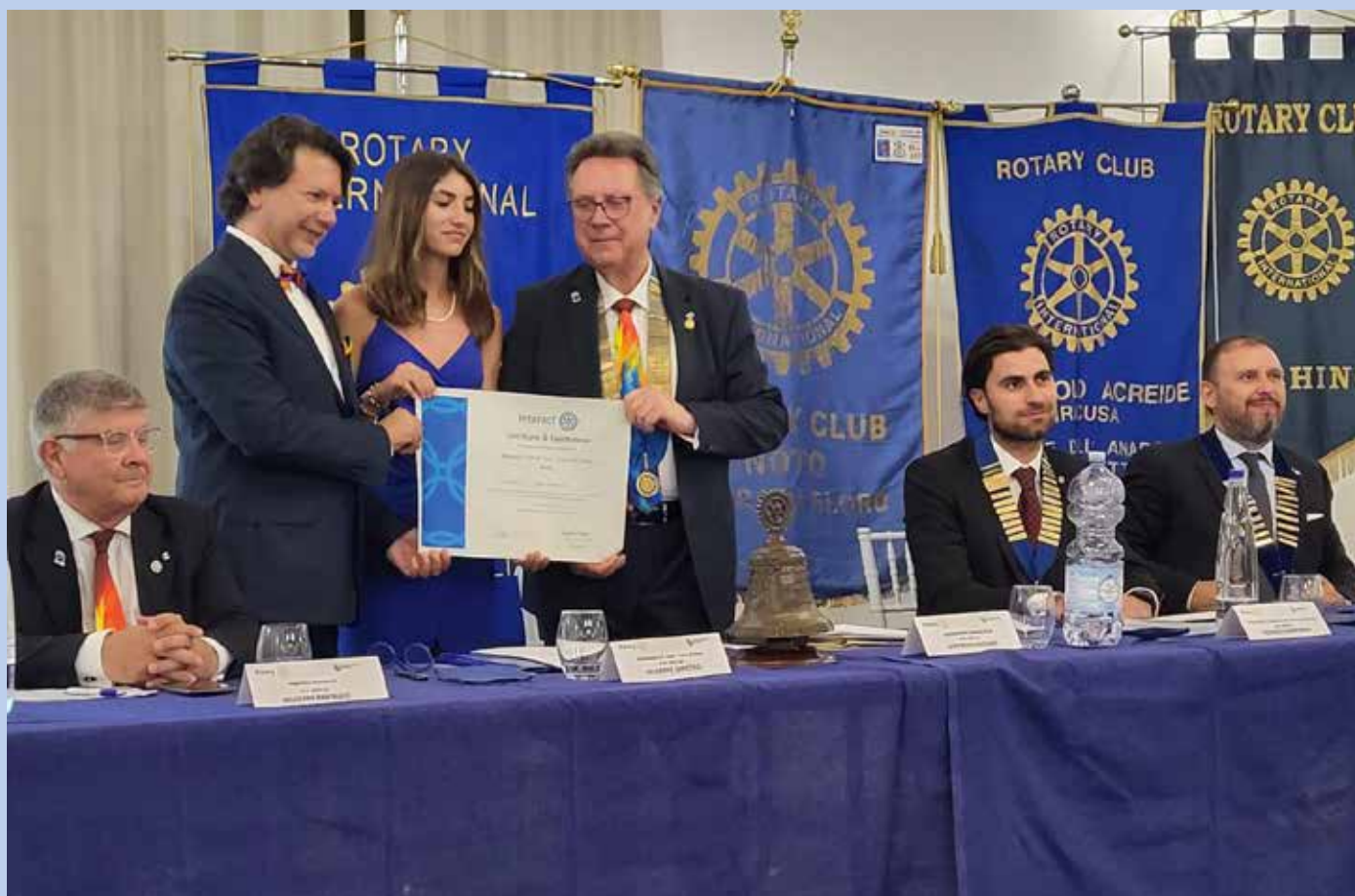
Il governatore Goffredo Vaccaro consegna il Certificato di costituzione per l'Interact di Noto