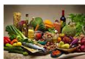
valorizzazione della dieta mediterranea