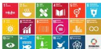
Convegno sullo sviluppo sostenibile