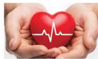
“Questioni di cuore”