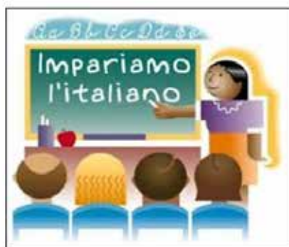
Corsi di alfabetizzazione