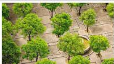
Piantumazione 3500 alberi