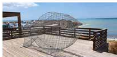
Plastic free (il pesce)