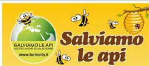
Salviamo le Api