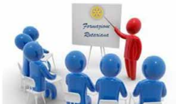
Corsi di formazione rotariana