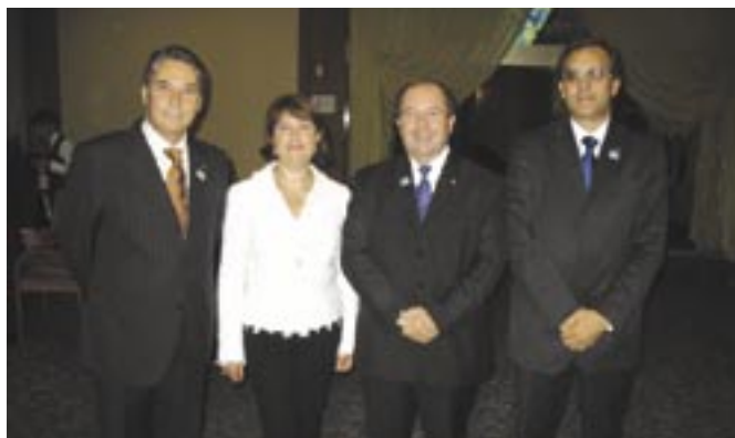
Agrigento, Aragona Colli Sicani, Canicatti