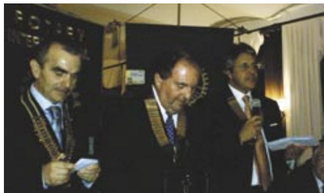
Castelvetrano - Valle del Belice e Mazara del Vallo