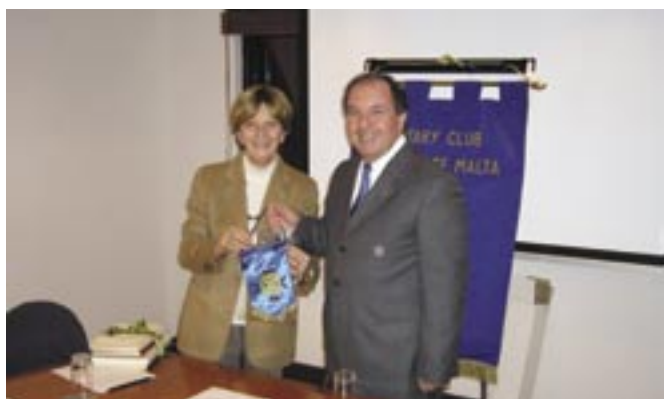
La Valette - Malta