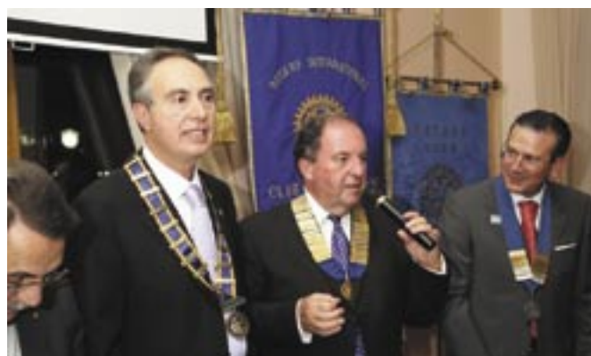
Lercara Friddi e Mussomeli - Valle del Platani