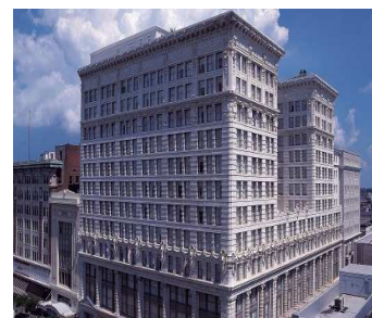
NEW ORLEANS THE RITZ CARLTON