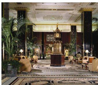
NEW YORK THE WALDORF ASTORIA