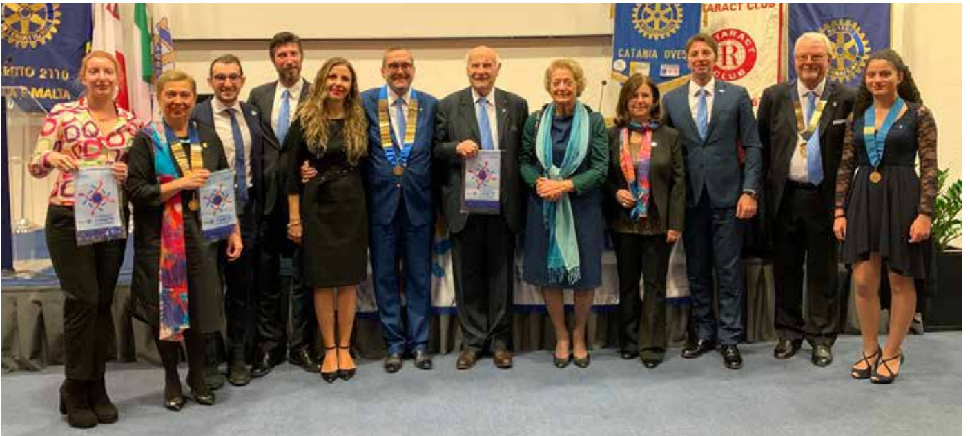
Catania Est, Catania Ovest