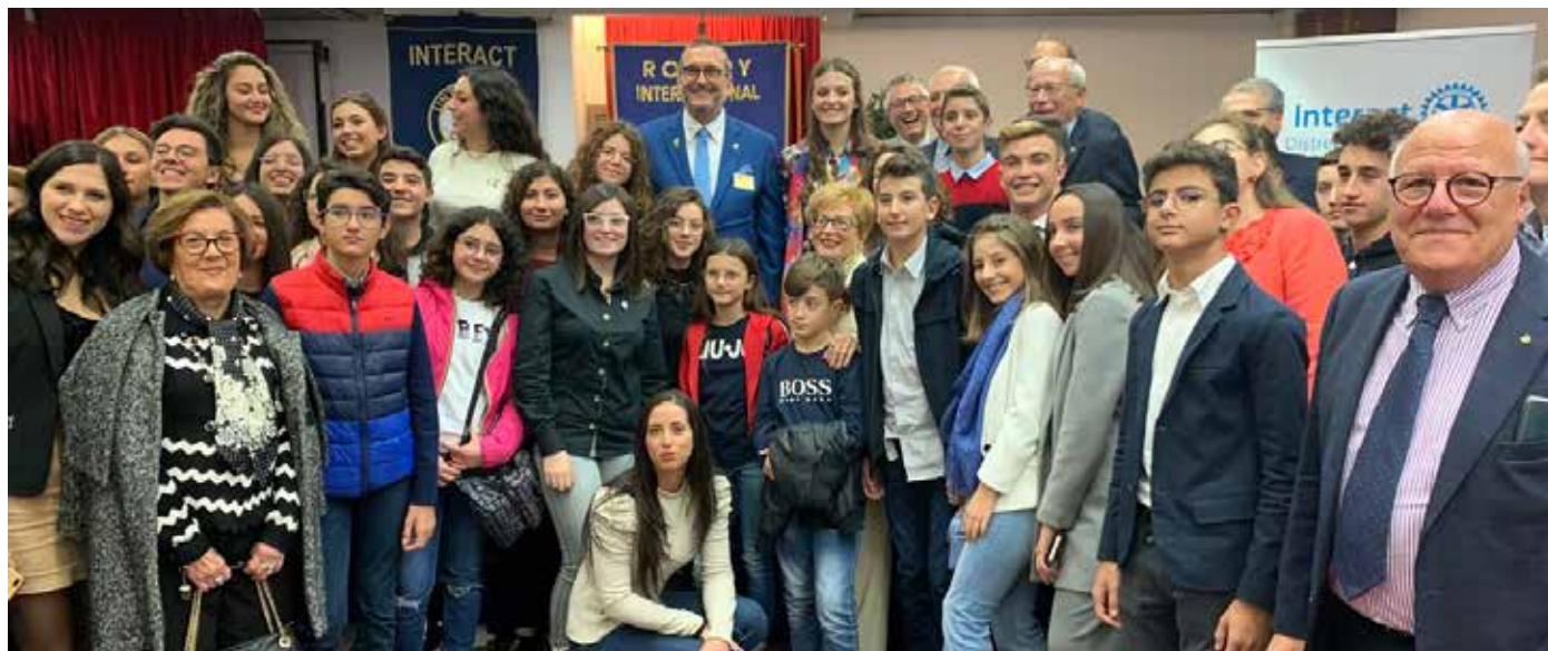
Assemblea distrettuale Interact