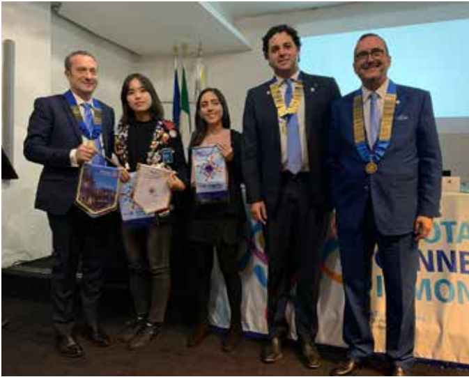
Catania Nord, Catania Sud