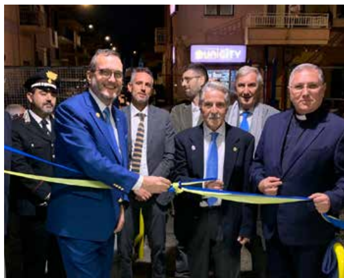
Ribera, inaugurazione centro assistenza