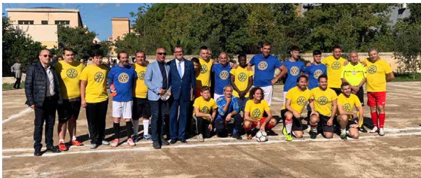
Partinico, inaugurazione campi