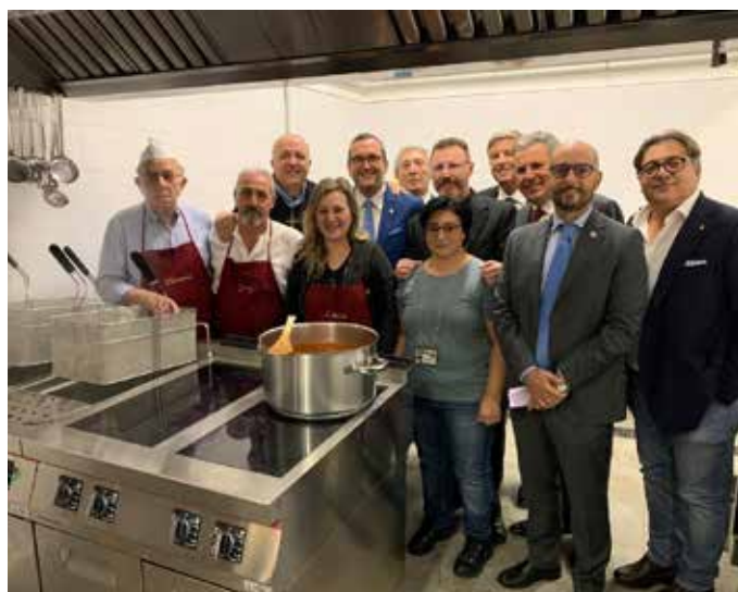
Palermo, consegna mensa al Don Orione