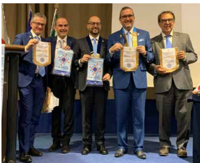
Palermo Baia dei Fenici, Palermo Teatro del Sole