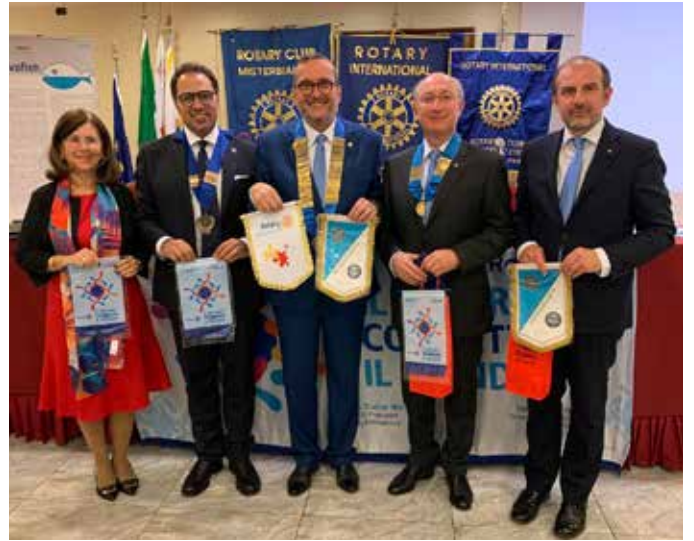
E-Club 2110, Misterbianco