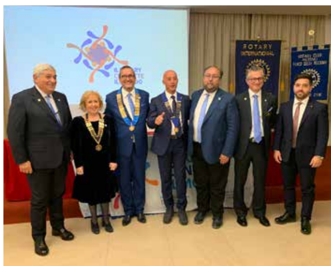
Palermo Costa Gaia, Palermo Parco delle Madonie